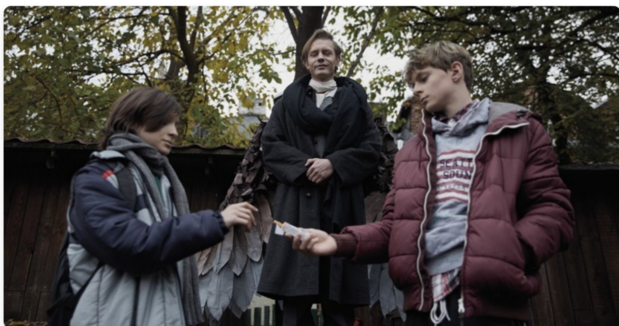
Trwa internetowa akcja dla podopiecznych Domu Aniołów Stróżów "Moc Aniołów ma swoje granice" Dom Aniołów Stróżów