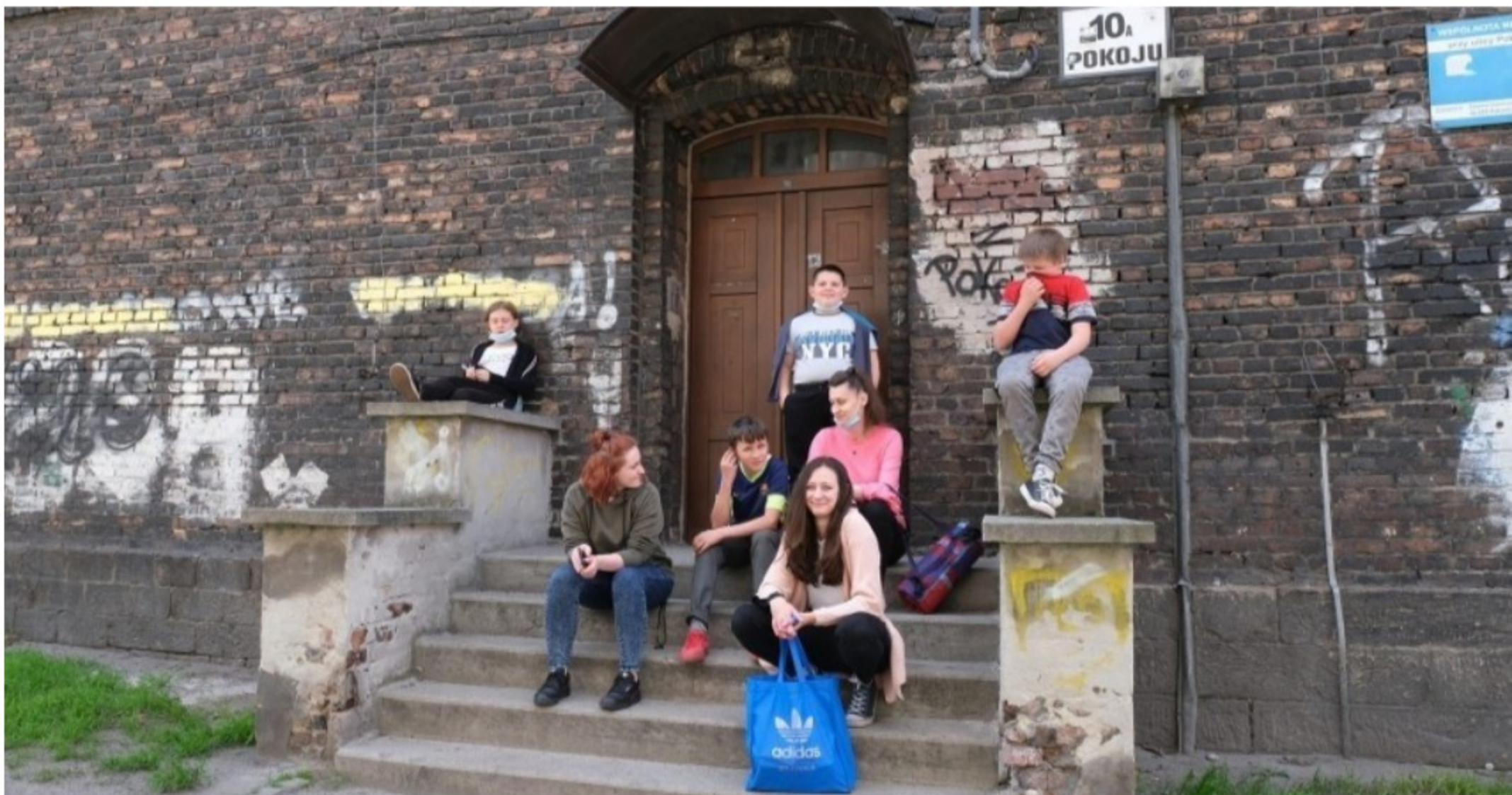
fot. Arkadiusz Gola