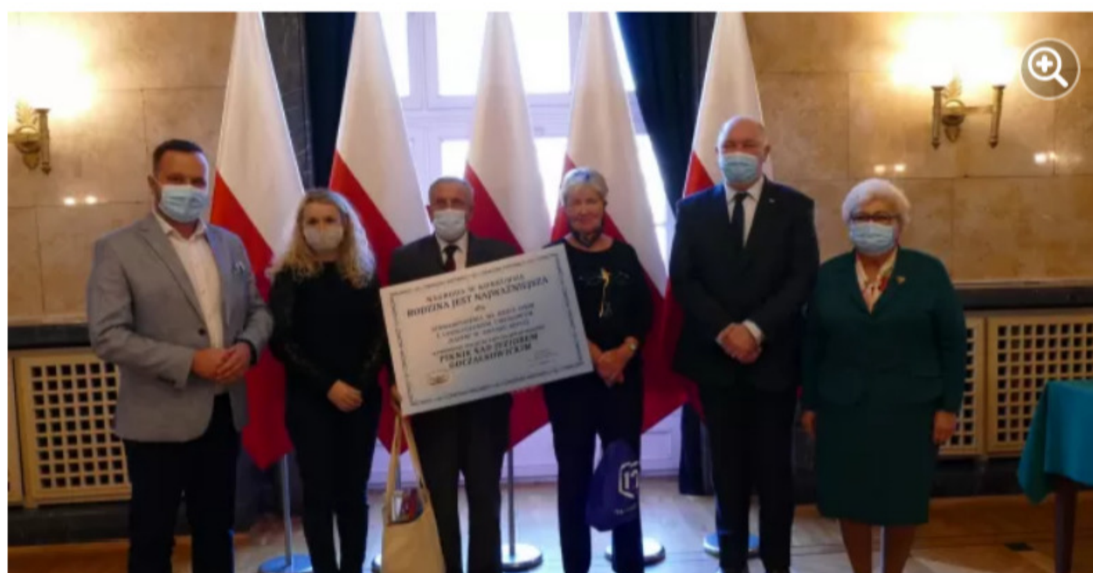
Bielskie stowarzyszenie "Razem" wyróżnione w konkursie wojewódzkim

Skomentuj (1) Udostępnij na FB Wydrukuj Oceń 3 / 0