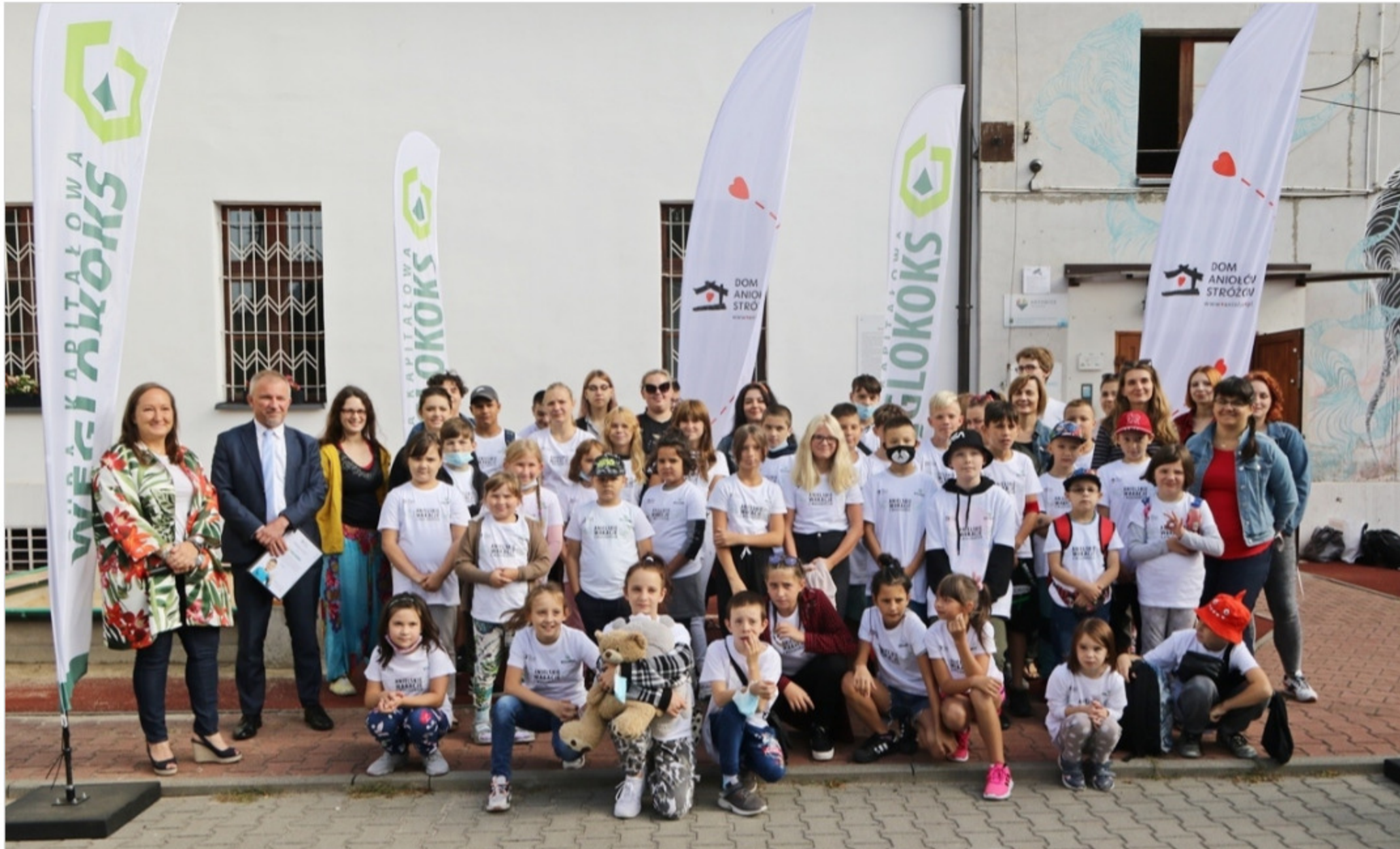
Pamiętkowe zdjęcie uczestników Anielskich Wakacji z Węglkoksem

Ponad 40 podopiecznych Domu Aniołów Stróżów w środę, 18 sierpnia, wyjechali na wakacje nad Jezioro Żywieckie. Było to możliwe dzięki wsparciu sponsorów. Głównym partnerem Anielskich Wakacji kolejny raz jest katowicki Węglkokso.