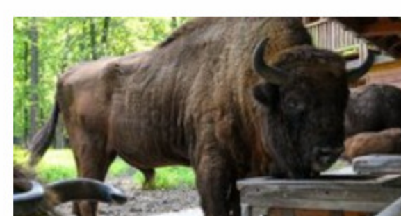
Żubry (5) 0.41 MB