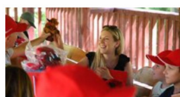
Żubry (6) 0.27 MB