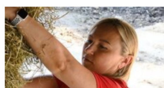
Żubry (3) 0.39 MB