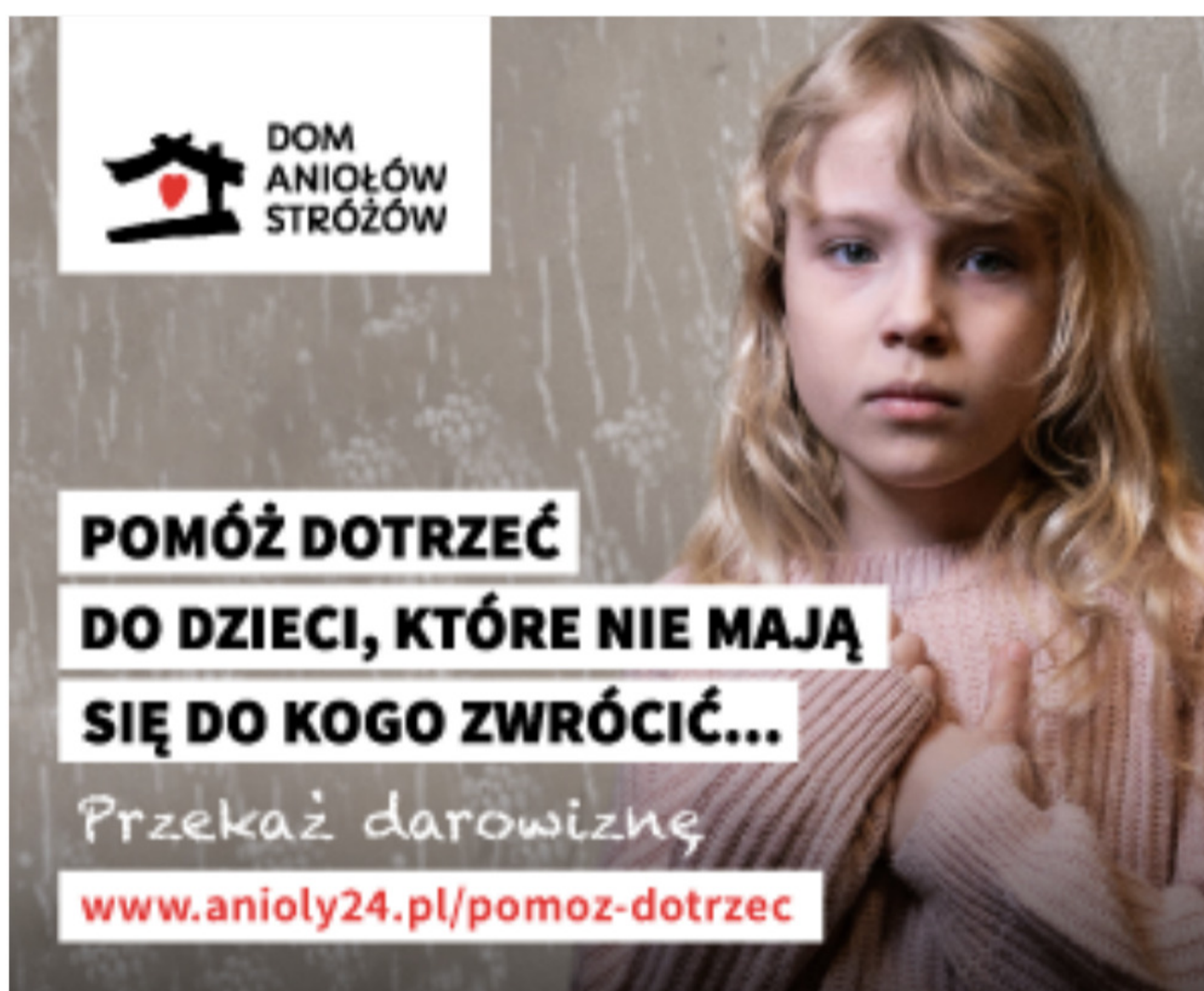
Dom Aniołów Stróżów