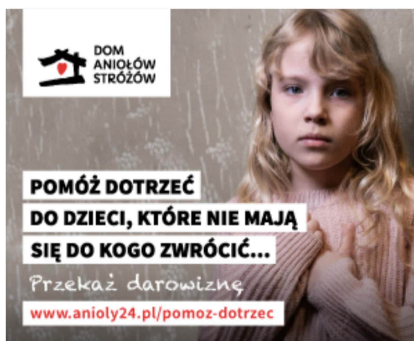
Dom Aniołów Stróżów