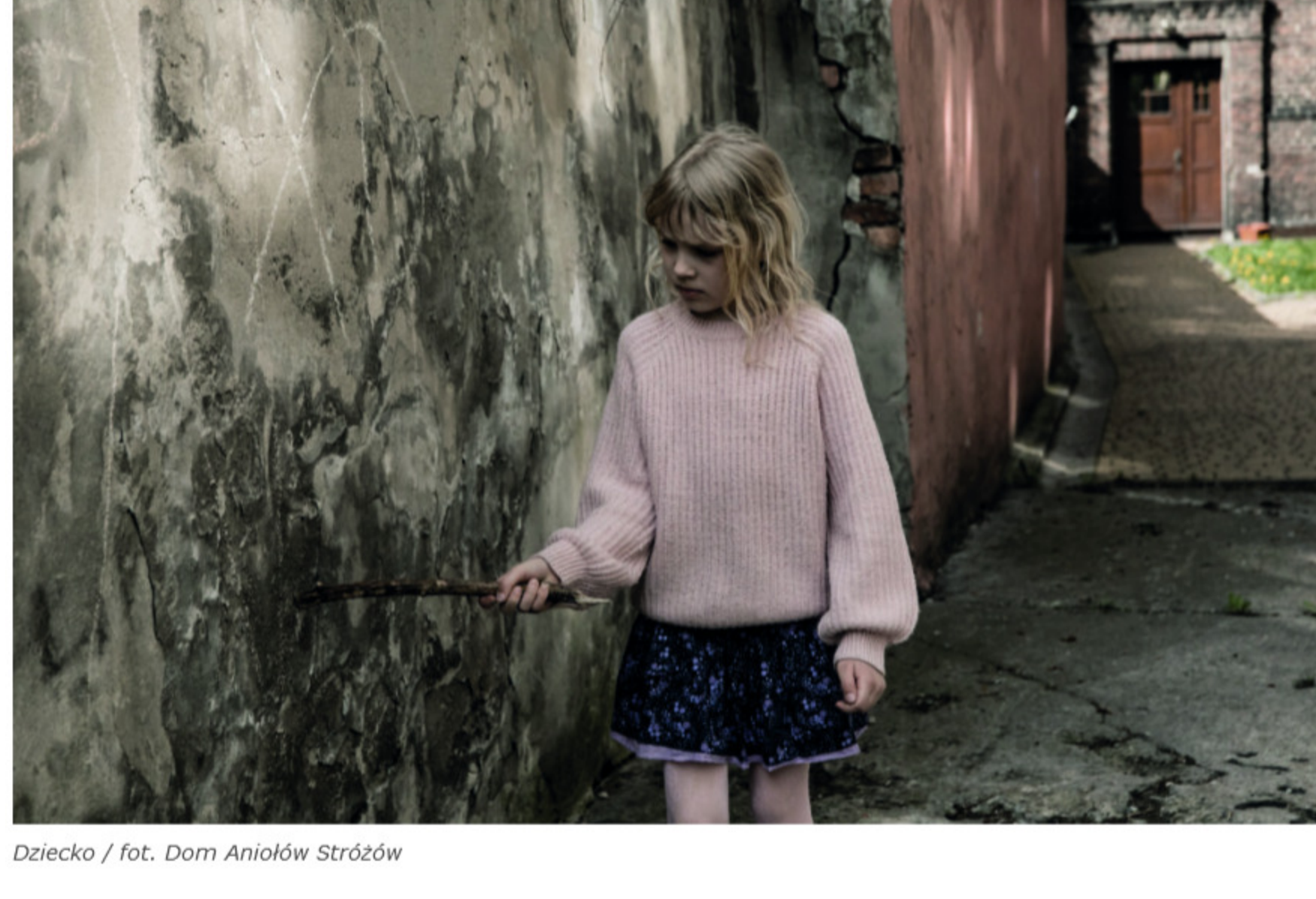
Dziecko